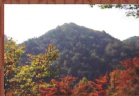
県史跡・篠脇城跡

利用を希望される方は、令和5年10月20日(金)【必着】までに、①氏名、②郵便番号、③ご住所、④当日連絡がとれる電話番号、⑤利用人数を、電話・FAX・郵送のいずれかで、事務局あてにご連絡ください。