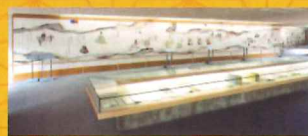
和歌文学館「古今和歌集絵巻」