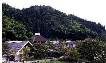
古今伝授の里フィールドミュージアム全景

アクセス：長良川鉄道 徳永駅 徒歩20分(タクシー5分) 東海北陸自動車道 ぎふ大和インター下車7分