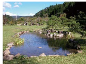
国名勝東氏館跡庭園