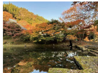
園内には光と水があふれています