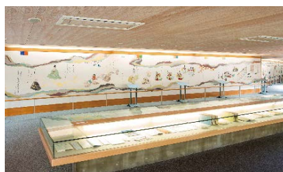
和歌文学館展示・壁画「古今和歌集絵巻」